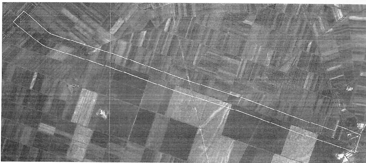
Приказ границе обухвата Плана детаљне регулације "Надаљске раскрснице"